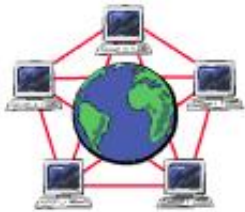
World Wide Web