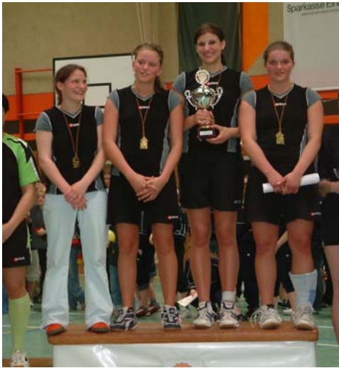
Unsere Siegermädels 2004